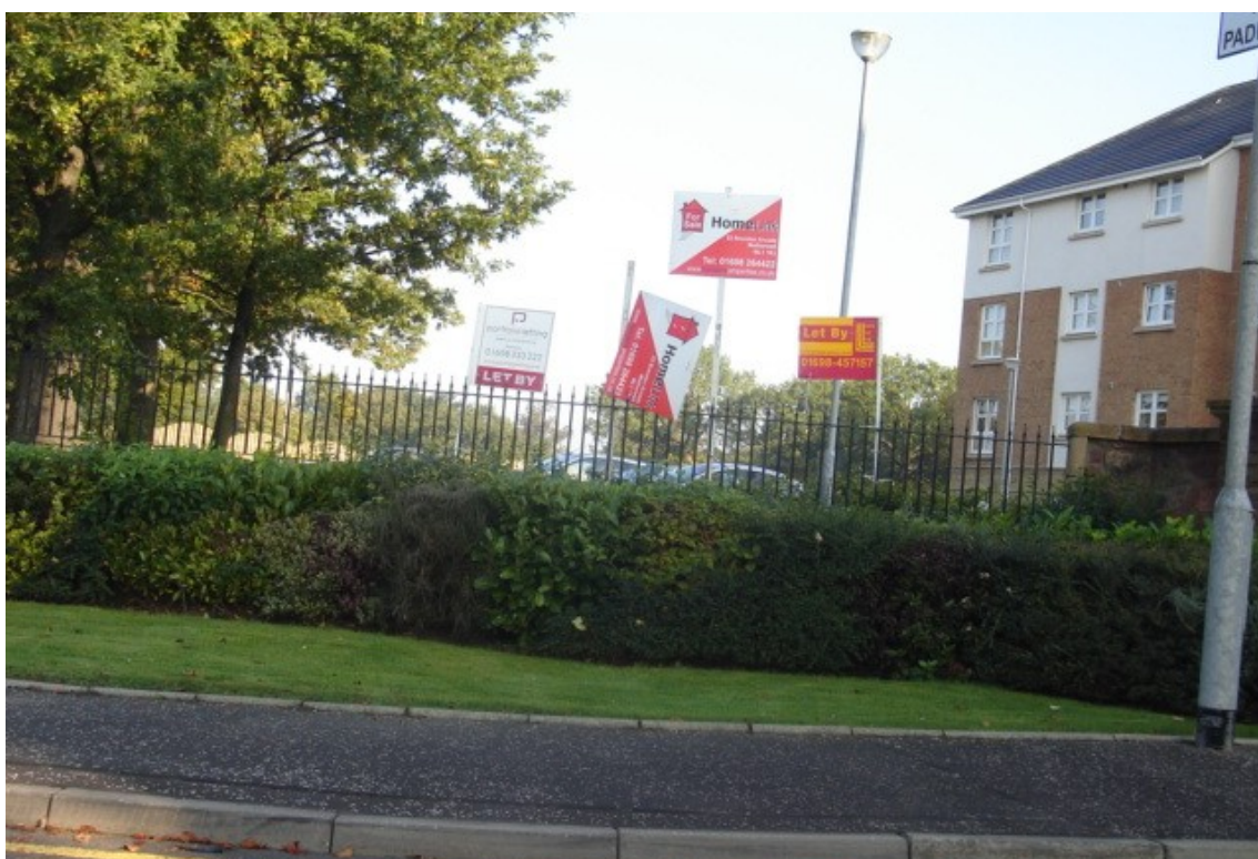
Fot. Tablice informacyjne agencji

Agencje najmu bardzo często reklamują się tablicami informacyjnymi umieszczanymi przed lokalem, który posiadają do wynajęcia.